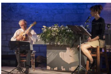
Concert Commemoriatiu JCA450 (Monistrol de M. 24.09.2022)