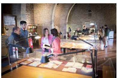
Jornada Portes Obertes Bibl. Catalunya (Barcelona 23.04.2022)