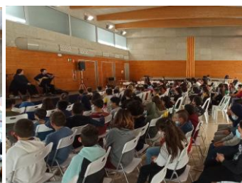
Concert educatiu escoles Monistrol (Monistrol de M. 08.04.2022)