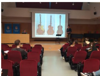
Conferència Universitat de Barcelona (Barcelona 18.10.2022)