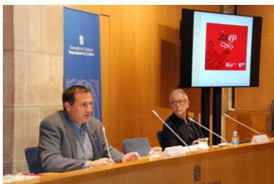
Roda de premsa Dept. Cultura Generalitat (Barcelona 31.03.2022)