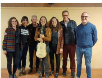
Concert De Elvas a Roma (Vacarisses 23.04.2022)