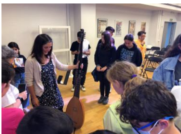
Sessió didàctica Escola Música Esparreguera (Esparreguera 25.05.2022)