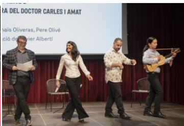
Concert Puntos Primeros El Born CCM (Barcelona 22.10.2022)