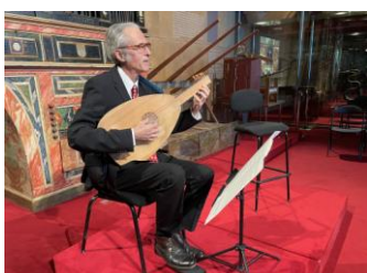
Concert JCA450 Museu de la Música (Barcelona 25.09.2022)