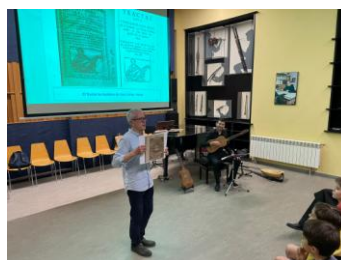
Sessió didàctica Escolania Montserrat (Montserrat 16.05.2022)