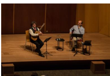
Concert-conferència Universitat de Lleida (Lleida 16.11.2022)