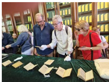
Visita guiada Biblioteca Catalunya (Barcelona 20.05.2022)