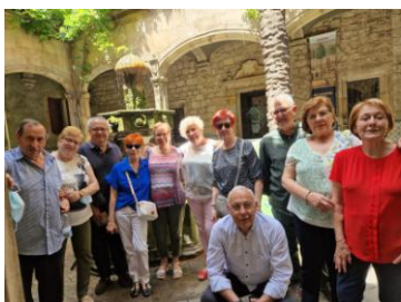
Visita guiada Arxiu Històric de la Ciutat (Barcelona 20.05.2022)